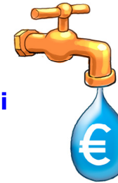
Lentelė vandens švaistymo skaičiavimui